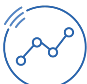
VOLLER FILTER INDIKATOR