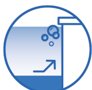
Boden, Wände & WASSERLINIE