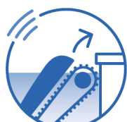
HOL MICH AB FUNKTION