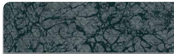
NATURAL PEARL Schiefergrau [702] Art.-Nr. 0180041M