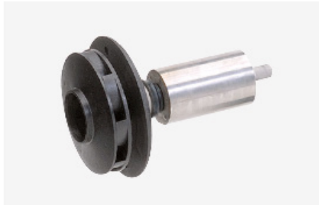
DRUCKSTARK: HYDRALISCH OPTIMIERTES LAUFRAD