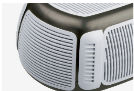
FEINE SIEBEINSÄTZE ZUM SCHUTZ DER DÜSEN VOR VERSCHMUTZUNG