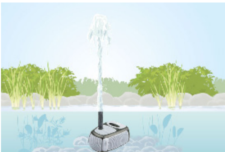
FÖRDERHÖHE BIS ZU 8 M