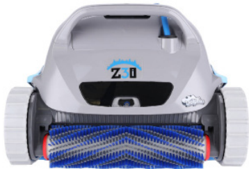
0180213M MIT POWERBRUSH MONTIERT